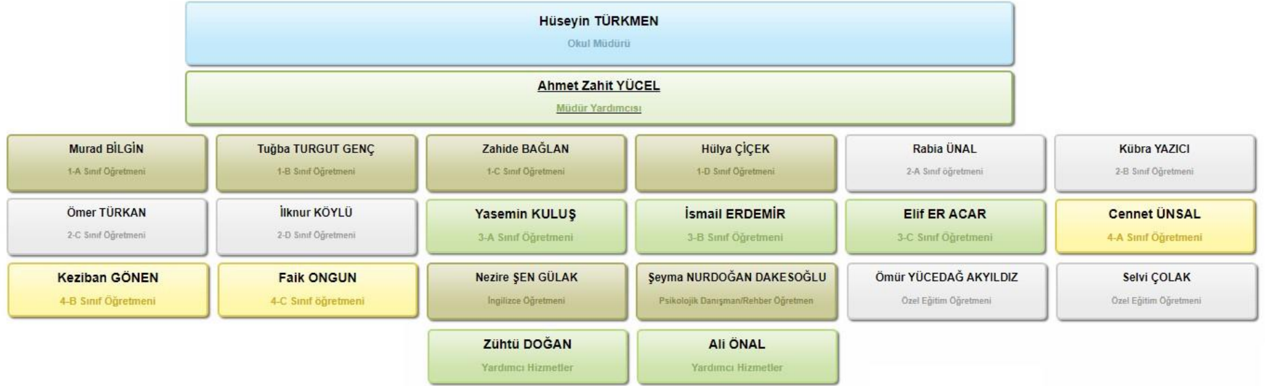
Şekil 1: Organizasyon Şeması