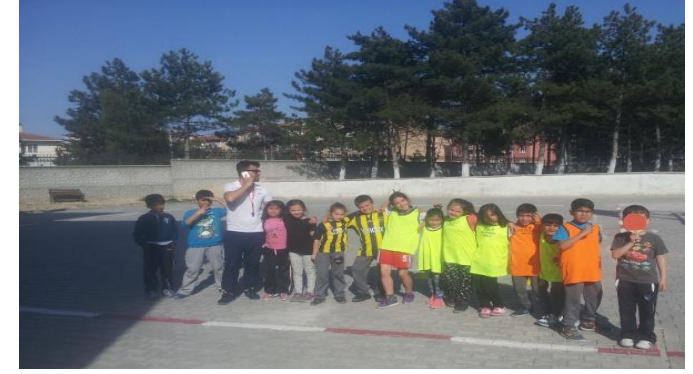
Yaz Spor Kurslarımız