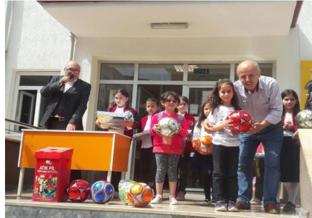
Atık Pil Toplama Ödül Töreni