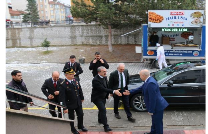
Robotik Kodlama Sınıfı Açılışı

Okulumuzun temel girdilerine ilişkin bilgiler altta yer alan okul künyesine ilişkin tabloda yer almaktadır.