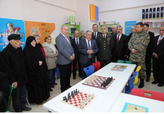
Zeka Oyunları ve Kütüphane Açılışı