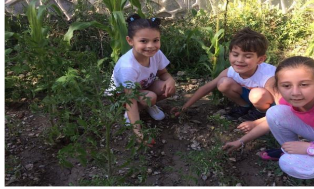
Okul Uygulama Bahçemiz