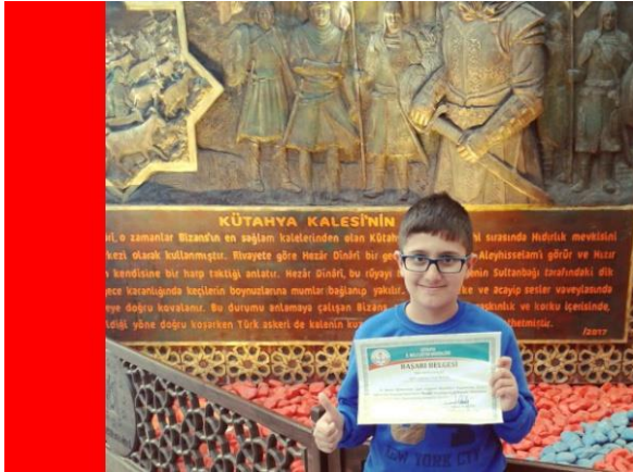
İlkokullar arası resim yarışması ödülü Okul Künyesi